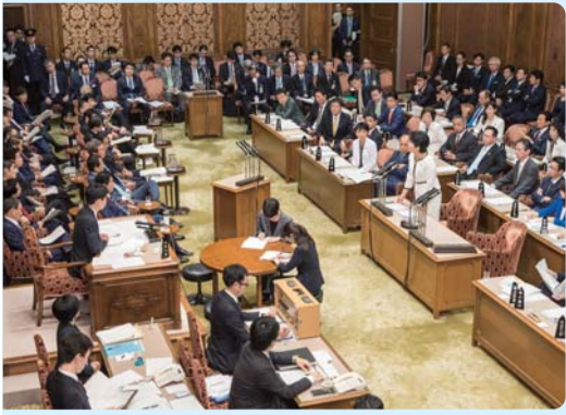
参議院予算委員会 自由民主党を代表して質問。 (平成28年10月5・6日) 与党といえども政府に対して緊張感のある真剣勝負で臨み、建設的な問題提起を心掛けています。