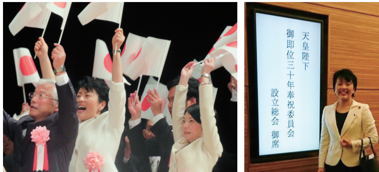
平成30年11月山形県にて 平成30年11月東京都にて

今上陛下のご譲位と、皇太子殿下の第126代皇位継承に向けて、世界から尊敬される日本の国柄や伝統を探究し、晴れやかに御代替りがお祝いできる国民的機運を高めます。