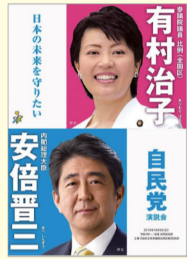
屋外・室内共用ポスター