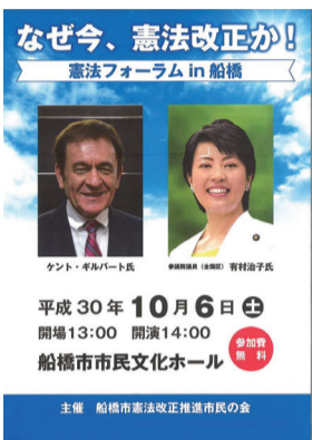
平成30年10月千葉県にて