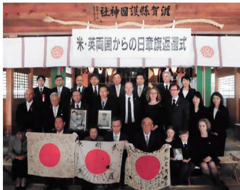
平成30年4月滋賀県にて

ふるさとを想い国難に殉じられた戦没者の尊厳を守り、真の和解を進めています。命を尊ぶ視点から、いじめや虐待の根絶を訴え、真の平和と日本の安全を確かにするためには何が必要か、国民の皆さまに真摯に語り続けます。