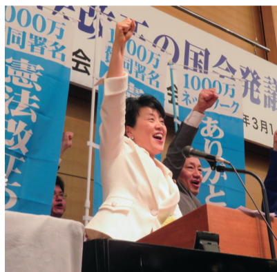
平成30年3月憲政記念館にて

自民党の総務会は、平時における最高意思決定機関です。参議院自民党を代表して総務会長代理となり、党執行部としてここでの発言権を確保しています。