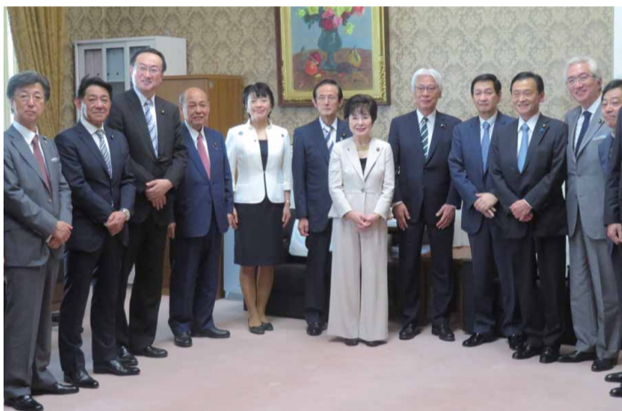
参議院自民党執行部 正副議長を囲んで 令和元年8月1日

参議院における今年度国家予算審議では、政審会長として与党最初の質問に立ち、1時間半の質疑は全てNHKで全国中継されました。1370年以上続く日本の「元号」についても議題に。