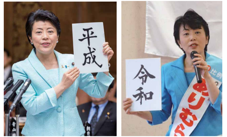
参議院予算委員会に臨む 平成31年3月4日

新鮮な気持ちで初心を忘れず、国家・国民益を具現化する大事な議席を、心してお預かりさせていただきます。