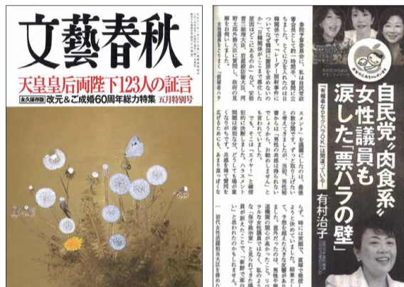
月刊「文藝春秋」に論考を発表 令和元年5月号

日本の安全と繁栄、誇りある国づくりの先頭に自民党が立ち、その中核で一つ一つの事に丁寧に向き合っています。