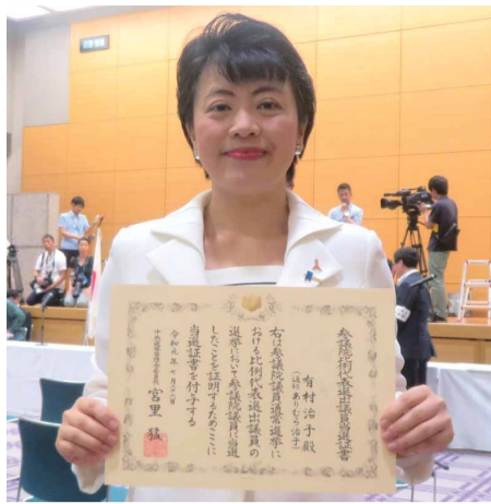
総務省にて当選証書授与式 令和元年7月26日

参議院自民党政策審議会を代表し、時に保守政治家として、また女性の立場や全国区選出議員の経験をふまえ、党幹部と渉合います。